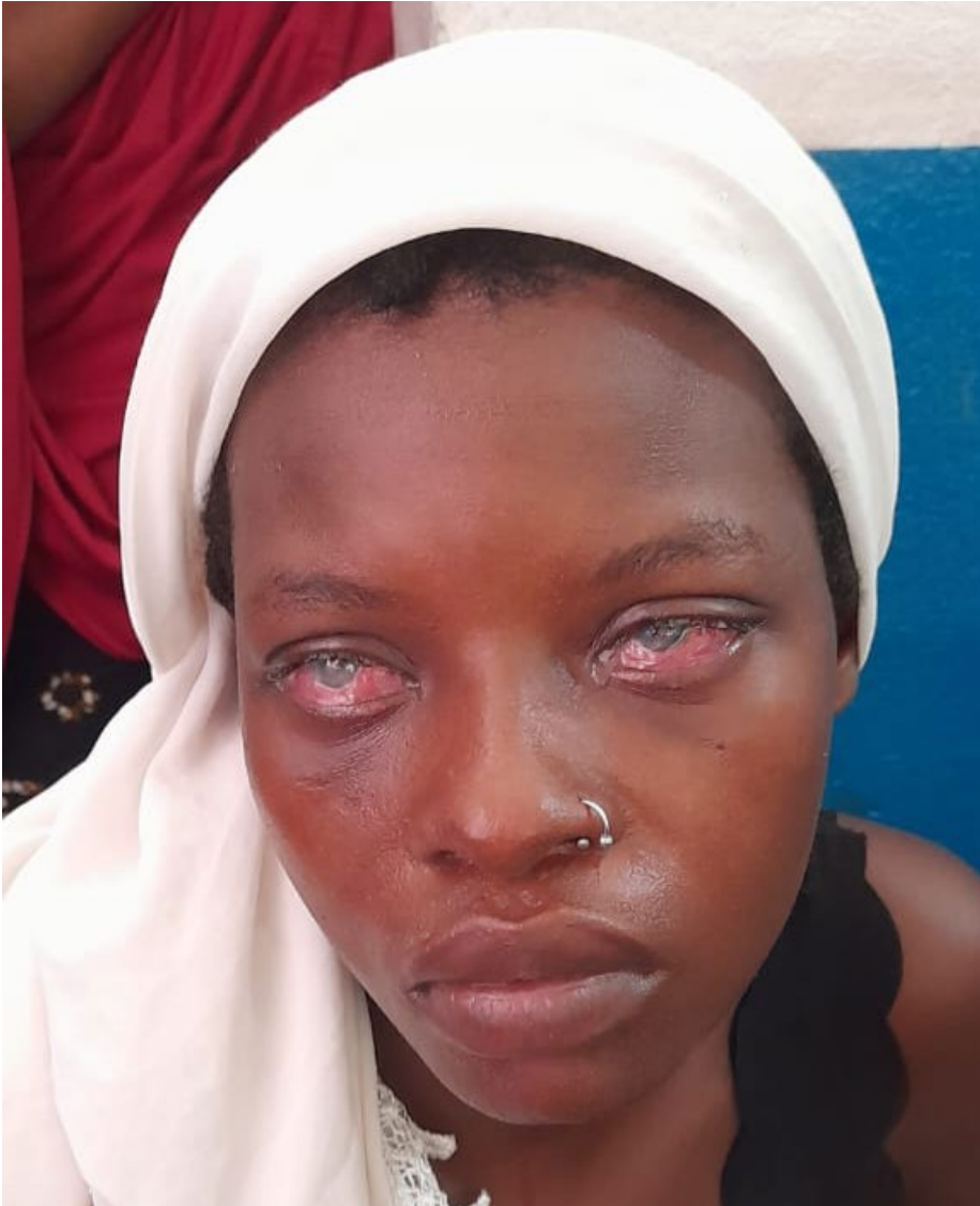
orumèla mittaikho sihikhanle seiyo màna sinnikumiherya mikatxamiho sintx- ène ni sòvelaveliha.

Mwálano oniwehaweha maitho, Espiritáli yùlupale ya Wámphula (HCN) onrwá omwaleyasaka miyèri iya mili (Fevereiro ni Marsu) wuntx- erereya w'aretta aniwereiwa maitho. Orett'ene yòwo wóphiya eprovinsiya yoCabo Delgado.